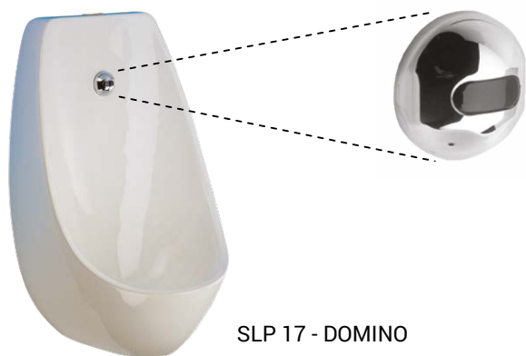
SLP 17 - DOMINO