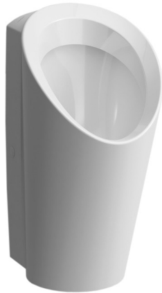
SLP 59 - LEMA