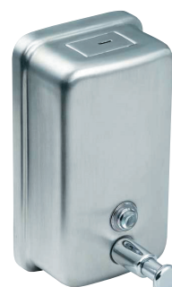
SLZN 07 95070 Нержавеющий дозатор жидкого мыла