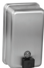
SLZN 39 95390 Нержавеющий дозатор жидкого мыла